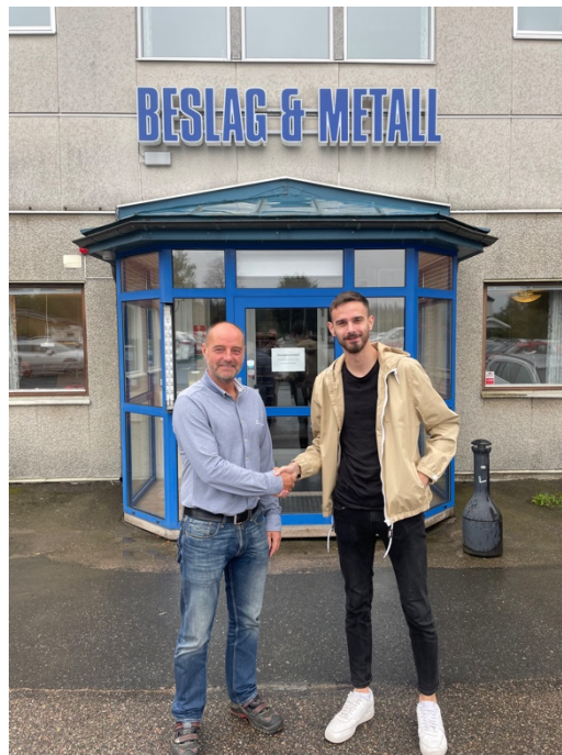
Figur 5: Beslag & Metall ansluter till VUA